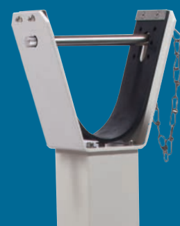
Boulon en acier affiné , pour cadenas à la lyre de repos (en option, cadenas non inclus à la livraison)