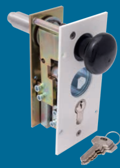
Verrouillage 3 et 4* Serrures triangulaires pour pompier à cylindre profilé montées au montant de la barrière (en option)