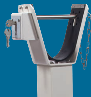
Serrure à cylindre profilé montée à la lyre de repos (en option)

*Versions 2 et 4 sont livrées avec clé prisonnière