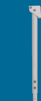
Lyre escamotable* avec contrepois supplémentaires inclus