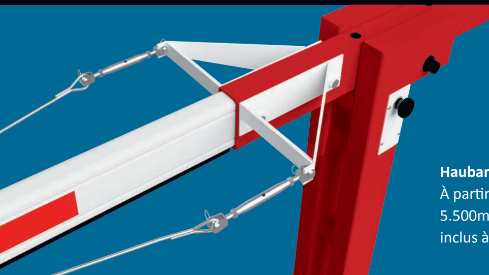
Haubanage À partir de la EH 55L (fermeture 5.500mm) un haubanage est inclus à la livraison

* À partir de la EH 40L (fermeture 4.000mm), soit une lyre escamotable soit une lyre de repos est obligatoirement nécessaire