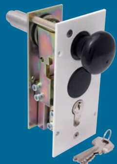
Verrouillage 1 et 2* Serrures à cylindre profilé, montées au montant de la barrière (en option)