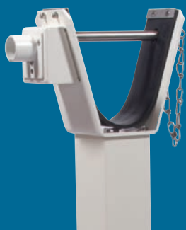
Serrure triangulaire pour pompier , montée à la lyre de repos (en option)

*Versions 2 et 4 sont livrées avec clé prisonnière